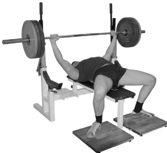
Рис. 2. Аппаратно-программный комплекс «Очувствленная» скамья для жима лежа в пауэрлифтинге»