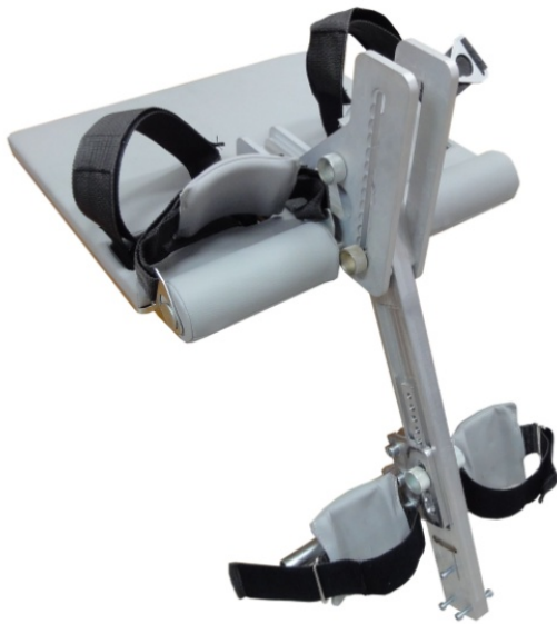
«Силоком» (Исполнение 02)