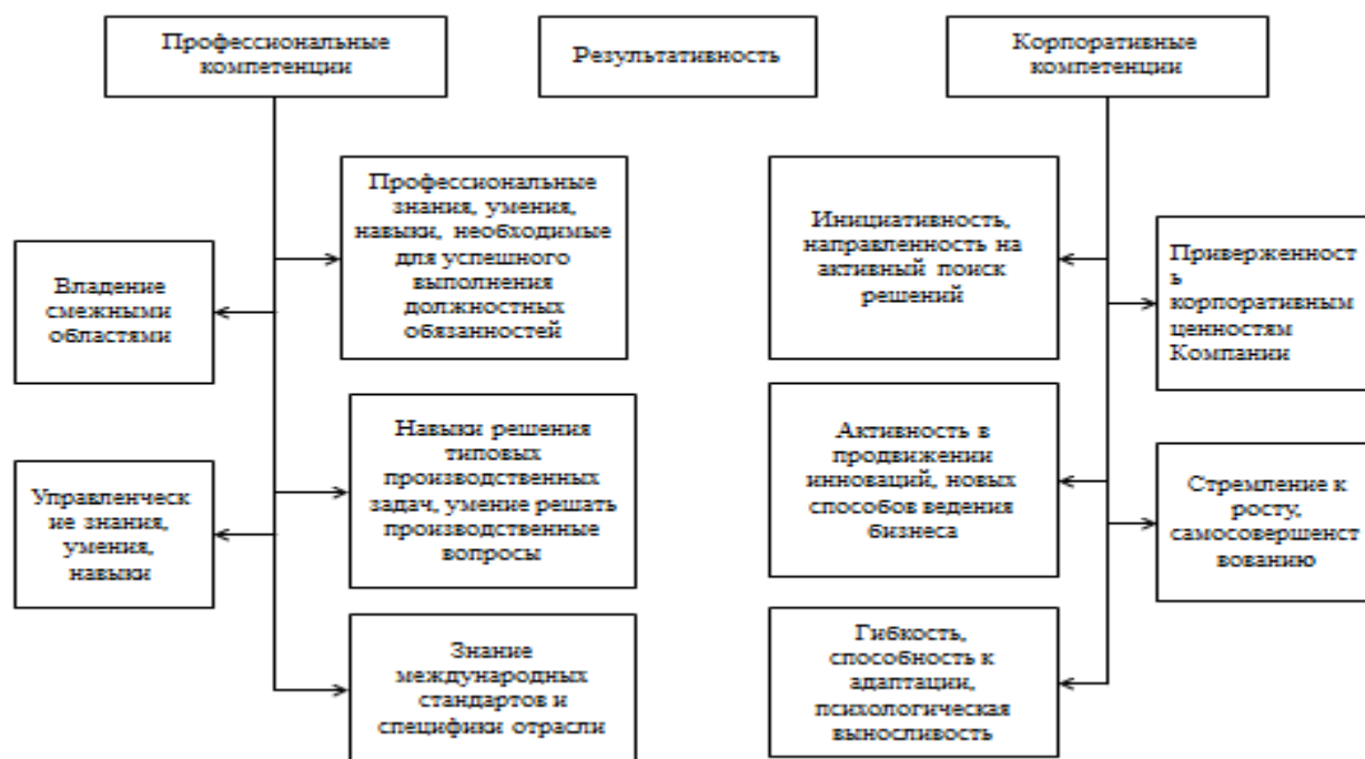
Рис. 1. - Критерии проведения самооценки специалистов ООО «Лукойл-Ростовэнерго»

Оценочная процедура подразумевает выполнение специалистами или служащими ООО «ЛУКОЙЛ-Ростовэнерго» в трехдневный срок после получения перечня должностных обязанностей и листа самооценки от непосредственного руководителя, должен заполнить его, руководствуясь выше указанными критериями. Работник сам определяет перспективы своего профессионального развития и передает заполненную форму непосредственному руководителю.