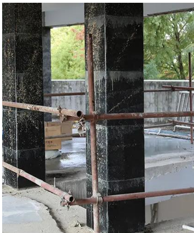
Рисунок 1 – Возведение железобетонной колонны из фибробетона на основе углеродного волокна

требуют обслуживания. Когда железобетонные колонны подвергаются осевому сжатию, стержни вызывают боковое расширение с очень малым предельным значением. Например, вокруг элементов могут быть созданы поперечные ограничения, чтобы предотвратить такое боковое расширение сжимающих элементов, чтобы улучшить способность элементов к сжатию и деформации. Возведение бетонных конструкций различной функциональности по технологии создания фибробетонов - идеальный выбор для проектов, подвергающихся суровым условиям окружающей среды, или для использования в крупных конструкциях, таких, как мосты и башни [12,13].