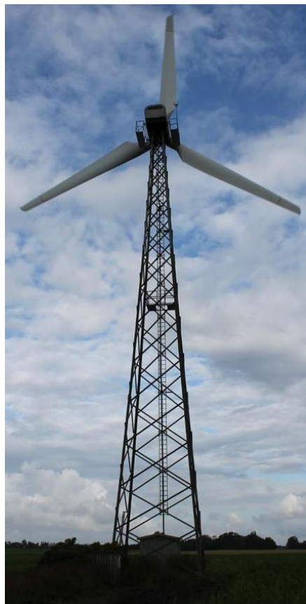
Рис.1. Ветроэнергетическая установка

плотность мощности – 350 \text{ Вт/м}^2 ; установленная скорость ветра – 3,0 \text{ м/с} ; номинальная скорость ветра – 11,5 \text{ м/с} ; скорость ветра, при которой установка отключается – 25 \text{ м/с} ; максимальная расчетная скорость ветра – 70 \text{ м/с} ; напряжение - 0,4 \text{ кВ} . Массогабаритные характеристики: диаметр ротора – 33 \text{ м} ; высота ступицы – 41,5 \text{ м} ; площадь охвата – 855 \text{ м}^2 ; вес ротора – 5 \text{ тонн} ; вес гондолы – 18 \text{ тонн} ; вес башни – 50 \text{ тонн} (в трубном исполнении); общий вес установки 73 \text{ тонны} .