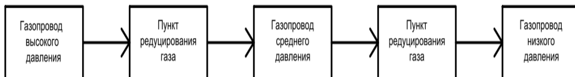
Рис.2. Схема редуцирования газа двухступенчатая

Существует две схемы транспортировки газа потребителям. Схема подачи газа потребителям при дегазации участка газопровода высокого давления представлена на рис. 2: газ сначала снижается с высокого давления (0,3МПа-1,2МПа) до среднего (0,005 МПа – 0,3 МПа) в ПРГ первой ступени, далее до низкого (до 0,003 МПа) в ПРГ второй ступени.